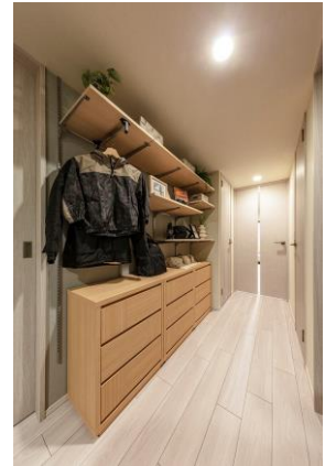
【拡幅した廊下への設置例】