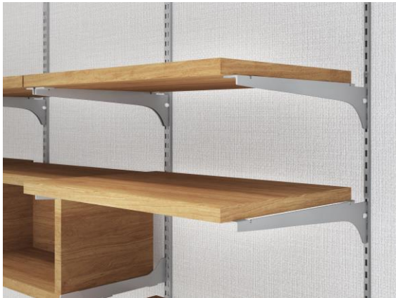
【背面支持金物と棚板】

棚やボックスなどの位置や高さを調節できる背面支持金物を使用した壁面家具は、「Large-Storage」、「Fit-Zone」どちらにも使用できます。また、居室だけでなく、広くなった玄関・廊下の「Fit-Zone」にも使用できます。