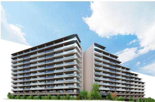
【ルネ松戸みのり台】