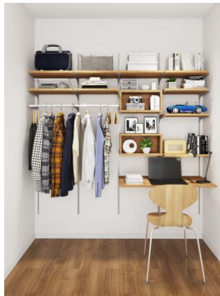
【背面支持金物の壁面家具】