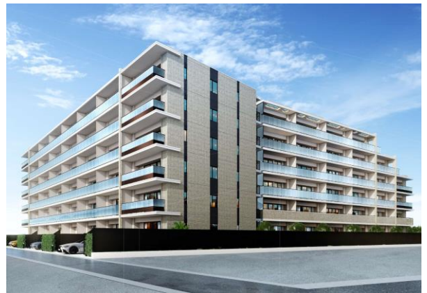
【ブランシエラ川崎大島】