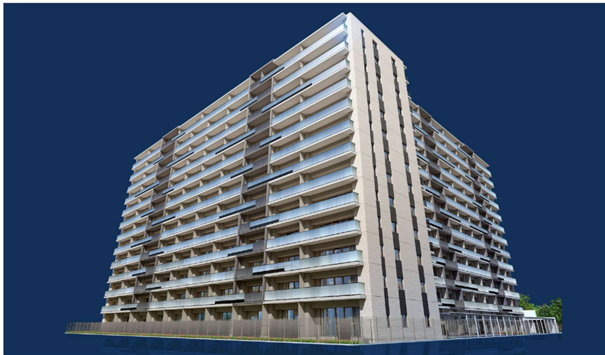
外観完成予想 CG ※3

本物件は、JR相模線「海老名」駅徒歩11分の地に誕生する、13階建て228戸の大規模プロジェクトです。専有部には、長谷工コーポレーションが独自開発した可動収納ユニット「UGOCLO（ウゴクロ）」（特許取得済み）※1を首都圏最多のファミリータイプ※2全148戸に採用しているほか、フレタスキッチンやフィットストレージなどの長谷工オリジナル商品も採用しており、プランバリエーションも若年層からご高齢の方まで幅広い世代に対応した全47タイプと豊富にご用意しています。多彩な暮らしを支える共用部には、保育所、ヘルスケアルームなどの施設のほか、ランドエントランスに水耕栽培設備を設置し、収穫時は入居者参加型イベントを予定しています。さらに、外部管理方式を採用した「smooth-e」や全国の提携医療機関を受診できるオンライン診療、入居者同士のコミュニティを醸成するサービス「GOKINJO」を導入予定で、多世代の方が豊かに暮らすことができる付加サービスもご提供いたします。