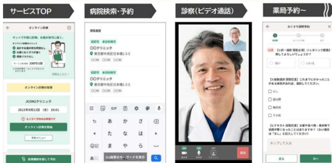
オンライン診療 スマートフォン利用イメージ

本物件では、国内の分譲マンションで初めて※各戸に専用のオンライン診療サービスをご提供し、通院にかかる時間負担の削減や二次感染の回避を目指します。さらに共用部では、動画で体操やヨガ、高齢者、親子でできる運動コンテンツなど多彩なメニューを備えた参加型のオンラインフィットネスサービスをご提供予定です。体重計や血圧計などの健康器具も共用部に設置予定で、居住者一人ひとりの日々の健康管理にとどまらず、居住者同士のコミュニティ形成をサポートします。