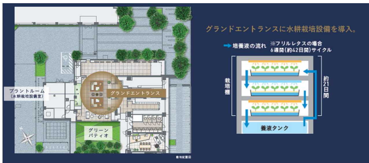
水耕栽培設備 概念図

入居者間のコミュニケーションや食育への貢献などを目的として、グランドエントランスの壁面内側に水耕栽培設備室を設置しました。栽培した野菜は無農薬栽培で低細菌化、泥がつかないなどのメリットがあります。エントランス空間を華やかに彩るだけでなく、収穫時は入居者参加型イベントを予定しています。