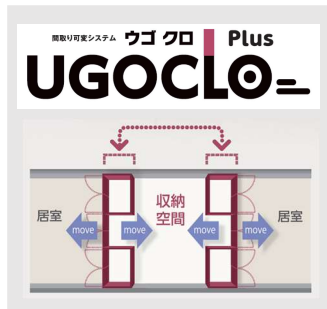
UGOCLO Plus 平面図

本物件では、2LDK～4LDK のファミリータイプ全 148 戸に長谷工コーポレーションが独自開発した可動収納ユニット「UGOCLO Plus（ウゴクロ プラス）」（2列可動）、「UGOCLO S（ウゴクロ エス）」（1列可動）を採用しています。お子様の成長などライフスタイルの変化に応じて居室の広さを変更したり、一方の居室をテレワークスペースにしたりと空間の自由度が高まります。