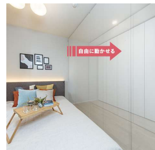
UGOCLO Plus 使用イメージ