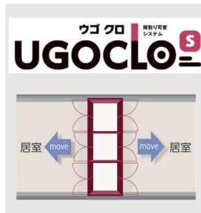
UGOCLO S 平面図