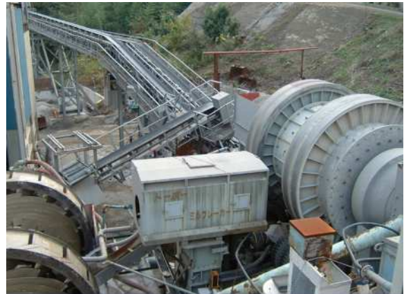
再生骨材の製造設備

BFCCU 研究会参加各社はサプライチェーン全体の CO 2 排出量削減ならびに資源の有効活用に取り組んでいます。今後は、環境配慮性の高いコンクリートである CELBIC-RA の実現場での普及・展開を図り、サーキュラーエコノミーの実現ならびに 2050 年カーボンニュートラルの実現に貢献してまいります。