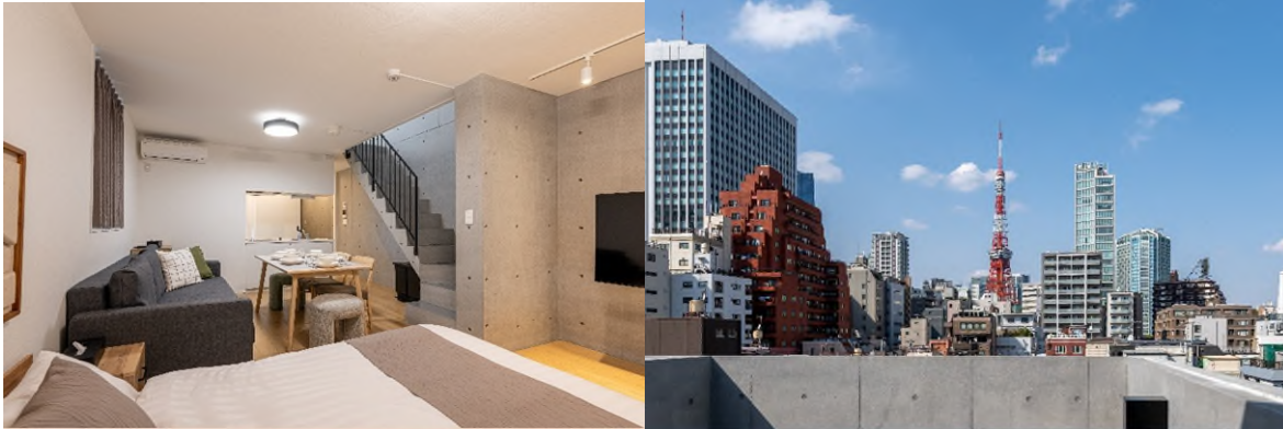
上階バルコニーから東京タワーを望むメゾネット