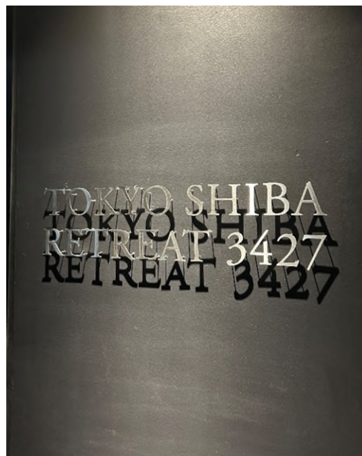
【TOKYO SHIBA RETREAT 3427】