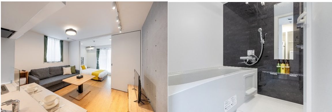
5名様まで快適に過ごせる広々とした1LDK、浴室は追焚機能付