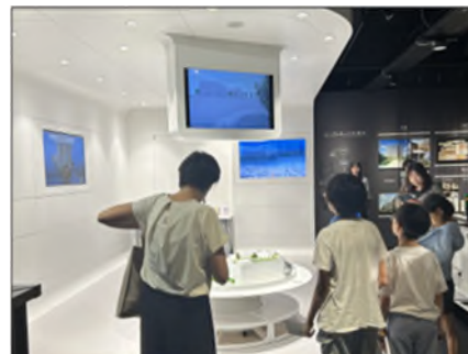
〔長谷工マンションミュージアム見学〕