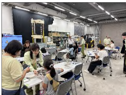
〔モルタル練り混ぜ体験〕