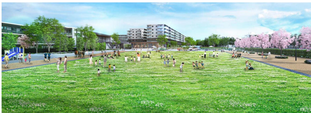
【キャンパスパークのイメージパース】

本エリアの中心には、千葉大学・千葉市と協議し、大学敷地・公園敷地にまたがる、広さ約12,000㎡もの「(仮称)西千葉キャンパスパーク」を整備します。キャンパスパークには本エリアを南北に貫通する最大幅員約12mの歩行者通路(共同住宅の敷地含む)をはじめ、歩行者専用通路を複数整備し、「跡地利用計画」に基づいた、周辺地域や千葉大学へつながる、ウォカブルなまちを実現します。今後も公民学での連携をさらに深めるべく、キャンパスパークの維持・運営について協議してまいります。