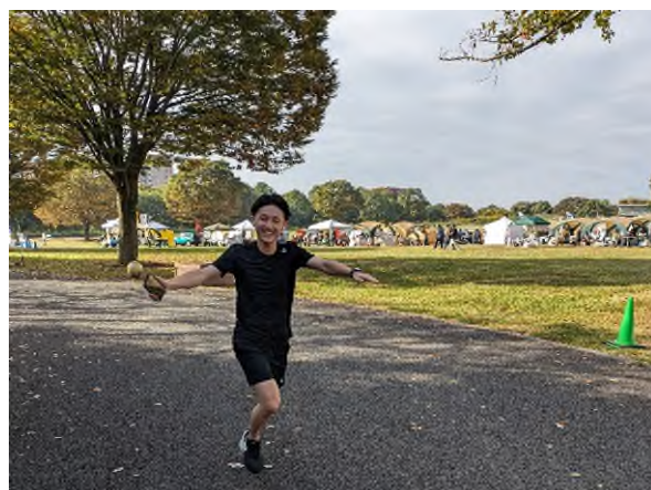
【LIVE RUN 当日参加者の様子】