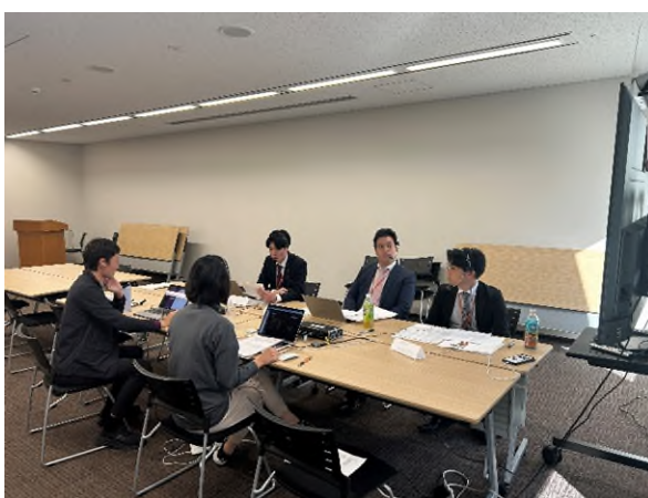
【LIVE RUN 実況中継の様子】