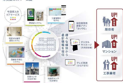
既存マンションへの ICT 提案スキーム図