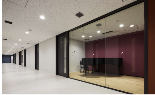
レッスン室・個人練習室