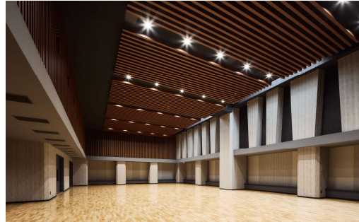
スポーツホール (体育館)