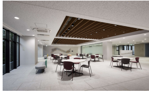
バツハラウンジ (エントランスホール)