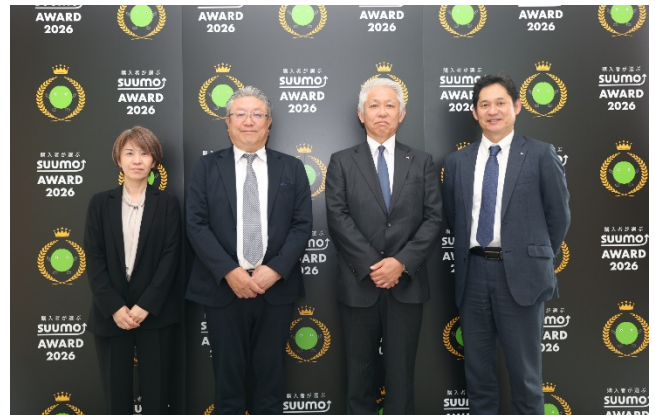
本アワード授賞式の様子