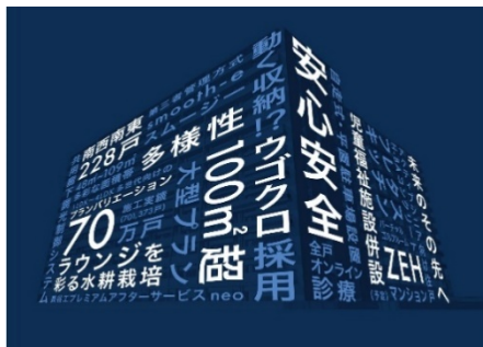
ホームページトップ画面(2024年9月時点)※2