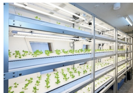
プラントルーム(水耕栽培設備室)※3