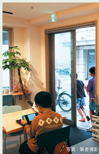
カフェスペースであそぶ子ども

「一人ひとりの居場所が生まれる毎日へ」をミッションに、利用者の方々だけでなく、家族の方や職員、地域の方々も自分の居場所を感じられる毎日を目指している。(https://naniwa-syofukai.or.jp/)