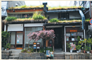
上段: れん len 蔵と表門。 下左: れん len 母屋入口。 下右: 窓 そうの外観。