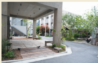
上段: チャノマと奥に続く私道。 下左: 塀をなくした私道。右側チャノマの庭にある木には鳥の巣箱がある。 下右: 新築の複合住宅 1Fピロティ。