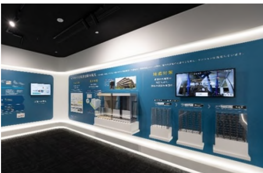
マンション防災・防犯

長谷工コーポレーション技術研究所による、様々な性能実験や研究開発によって生まれた技術をご紹介します。