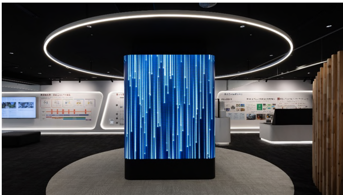
(HMB内観 / LED モニュメント)

当施設は、大阪メトロ堺筋線「北浜」駅から徒歩3分の場所に所在する長谷エコーポレーション関西の地下1階に誕生し、デベロッパーや建替え・再開発組合などのお客様を対象に当社およびグループ各社の取り組みと連携が生み出す技術開発、商品・サービスのプロモーション施設として運営してまいります。