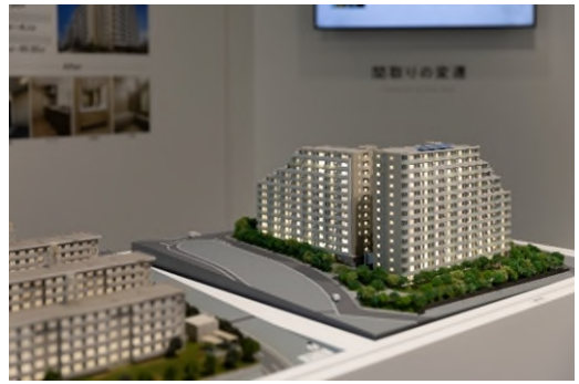
建替え・修繕と再開発

長谷工グループの技術や、未来への展望、お客様への思いを伝える映像がご覧いただける他、プレゼンテーションスペースとして様々なコンテンツを大画面 LED にてご提案します。