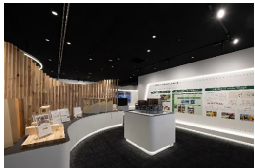
長谷工が取り組む木材活用

マンションの木造化・木質化に取り組む長谷工グループの木材を活用した取り組みや技術情報などをご紹介します。