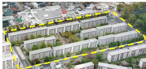
建替え前 「習志野台三街区住宅団地」

習志野台三街区住宅団地は 1967 年（昭和 42 年）8 月竣工、敷地面積 24,805.59 m 2 、鉄筋コンクリート造地上 5 階建・12 棟 318 戸の団地でした。竣工から相応の年数が経過し居住者の高齢化が進む中、耐震性不足に加えエレベーターが設置されていないことや建物・設備の老朽化が進んでいたことなどから「マンション建替え等の円滑化に関する法律」を活用した建替えを実施いたしました。