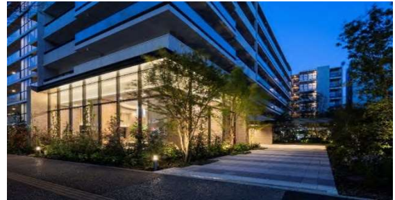
メインエントランスホール・アプローチ