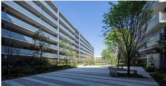
コミュニティガーデン