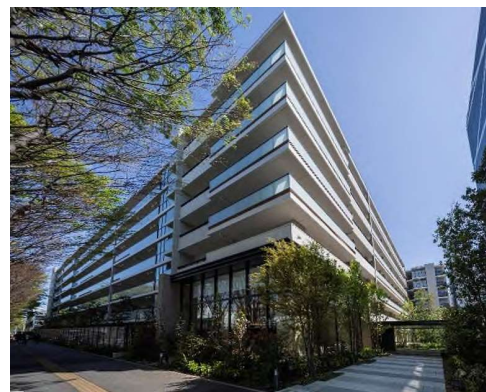
建替え後 『リビオシティ船橋北習志野』

『リビオシティ船橋北習志野』は地上 7 階建・4 棟、全 488 戸の大規模マンションです。南向き中心の配棟、広大なコミュニティガーデン（約 1,900 m 2 ）を含め 50%超の空地率を確保し、駅前立地でありながら、良好な住環境を実現いたしました。