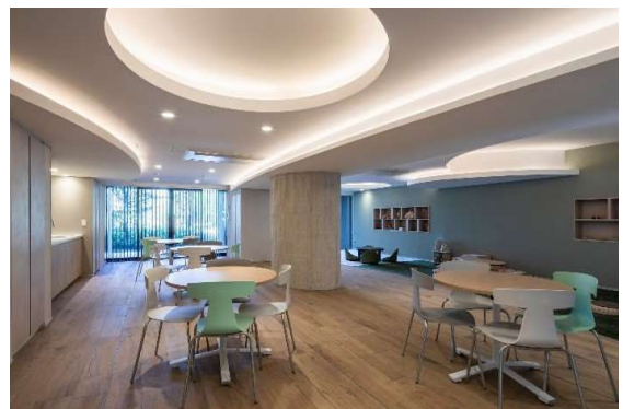
コミュニティルーム