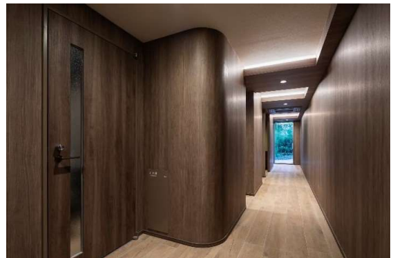
パーソナルブース