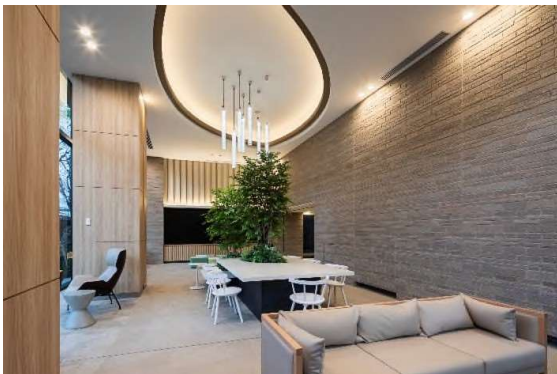
メインエントランスホール