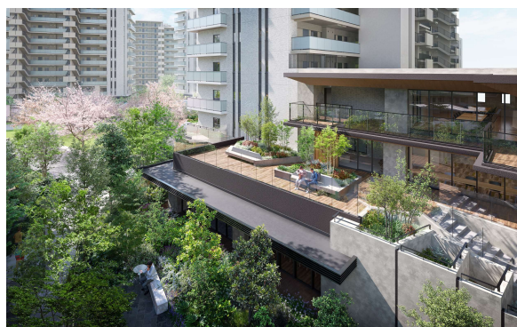
共用施設外観完成予想 CG

さらに、コードレス掃除機を充電しながら収納できる物入、電動自転車のバッテリー充電に対応した玄関収納、ワンタッチで全室（玄関と廊下は除く）の照明を消灯できるオール照明オフスイッチなど、忙しい毎日をスマートに支え、暮らしの質を高める工夫を随所に取り入れています。