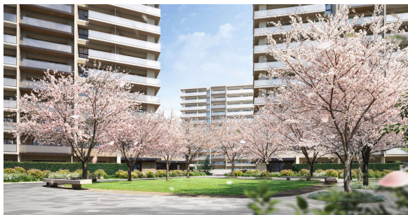
サクラリング完成予想 CG