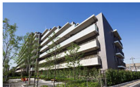
「ブランシエラ市川行徳」 木造ハウスの建て替え