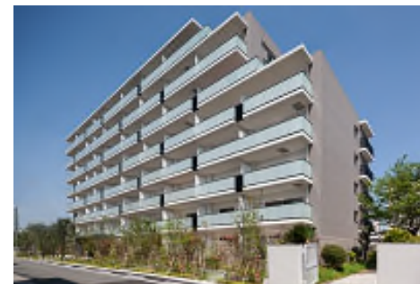
「ブランシエラ千林大宮」 同規模の再建築不可により 計画戸数を減少させた建て替え