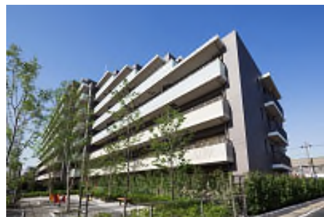
「ブランシエラ市川行徳」 木造ハウスの建て替え