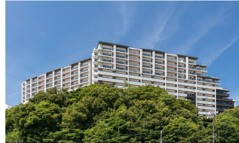
「エアヒルズ藤沢」 藤沢市初の円滑化法による神奈川県 最大規模(従前住戸)の建て替え