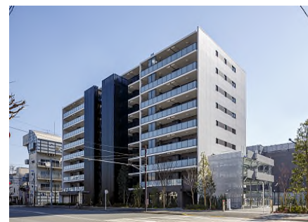
「シティハウス川崎富士見公園」 川崎市が進める社会福祉施設等の 整備を含めた建て替え事業