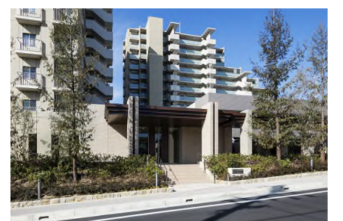
「シンフォニア新千里南町ガーデンズ」 全員合意の3棟120戸の 団地建て替え