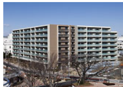
「オーベルグランディオ吉祥寺 I」 都市再生機構との事業協力による 仮住まい不要の建て替え