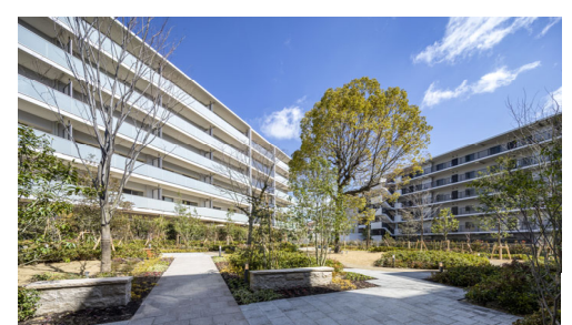
「ブランシエラ池田石澄」 敷地の半分以上を保留敷地として 戸建業者に売却した建て替え