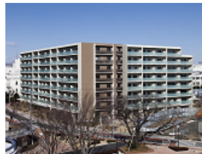
「オーベルグランディオ吉祥寺 I」 都市再生機構との事業協力による 仮住まい不要の建て替え