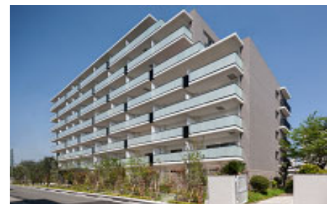
「ブランシエラ千林大宮」 同規模の再建築不可により 計画戸数を減少させた建て替え