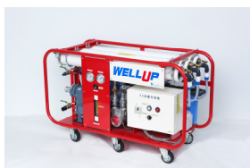
■非常用飲料水生成システム (メーカー参考写真)

「下水道直結トイレ」の『防災3点セット』をマンション内防災倉庫に常備しています。