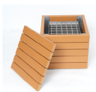
■かまどスツール (メーカー参考写真)