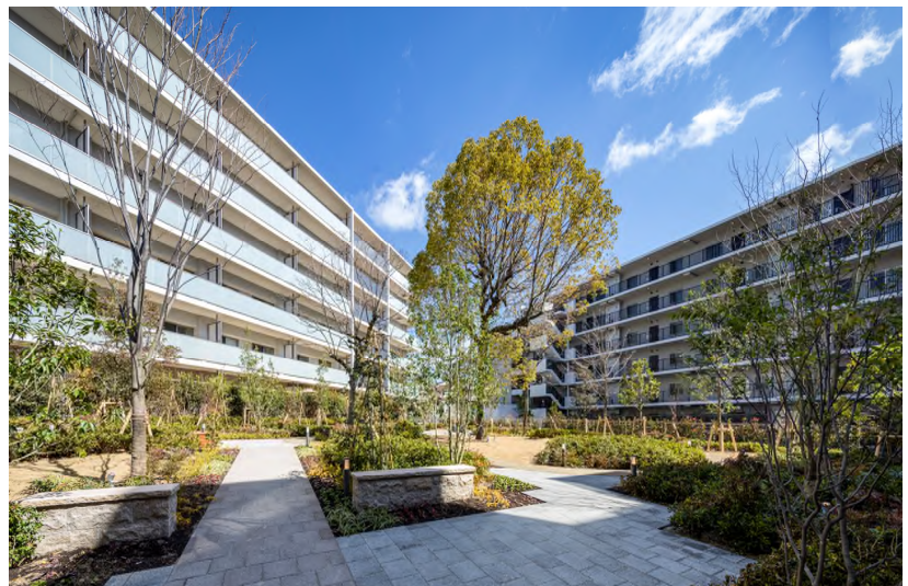
〔左：従前の「石澄住宅」の外観写真、右：従後の「ブランシエラ池田石澄」の外観写真〕

この件に関するお問い合わせは、 （株）長谷工コーポレーション 広報担当 福貴田・牛尾まで TEL：06-6203-1501 E-mail：Fumiya_Ushio@haseko.co.jp