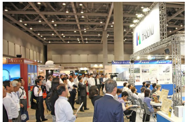
【第22回R&R建築再生展2017】の様子】