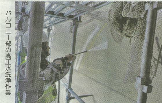
バルコニー部の高圧水洗浄作業

棟当たり4.5~5カ月間の工期で順次施工していった。 前回の大規模修繕の施工が別会社であることもあり、1期では建物の状況調査などを入念に行い、問題点や最適な対策などの抽出に時間を掛け、その内容を他工区にフィードバックした。 2期では2017年11月に施工した住宅棟2棟について、気温が下がる冬季の前に廊下側の塗装材の塗布を行うため、通常バルコニー部から掛かる手順を廊下側から始める必要性を居住者に説明し、理解を得た上で施工するなど、工期内に収めるよう心掛けた。 また3期では下層階に商業施設がある住宅棟と商業棟を行うことから居住者はもちろん、第三者災害の防止へ警備員を多数配置するなど細心の注意を払い工事に当たった。