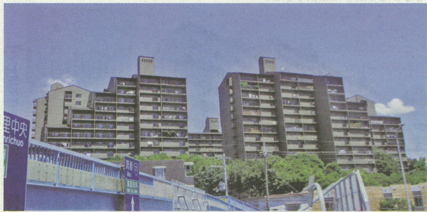
千里中央パーク・ヒルズの外観

電話06(6941)4152(代) http://www.haseko.co.jp/hrf/