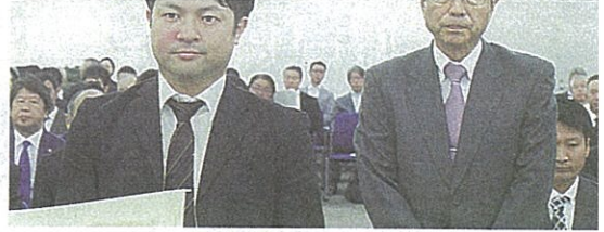
東京住宅サービス