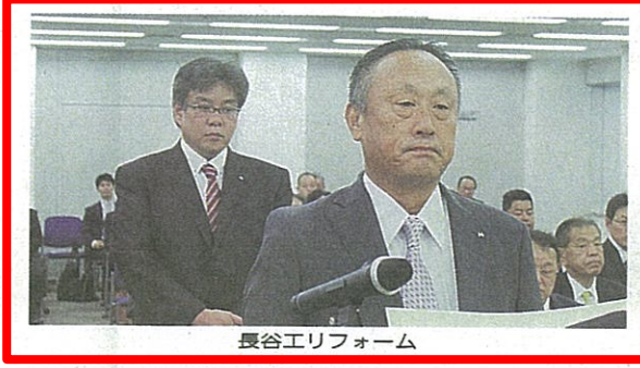
長谷工リフォーム