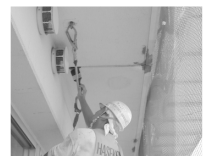
インサートの活用例