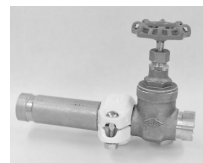
ハウジングバルブ