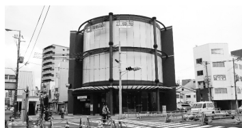
九条駅: 地下鉄中央線との連絡口となる西側出入口は、鏡とガラスを使い地域イメージを表現

3月20日、「尼崎」駅～「大阪難波」駅を結ぶ阪神なんば線が開通。阪神電気鉄道と近畿日本鉄道が相互乗り入れを行い、三宮と大阪難波を約40分、三宮と奈良を約80分で結ぶ。新線には、「九条」「ドーム前」「桜川」の3駅が新設された。阪神電気鉄道が乗り入れる山陽電気鉄道も含めると、新線開通で姫路から大阪・ミナミ、奈良方面への利便性が向上。途中の「大阪上本町」で「鶴橋」で乗り換えれば、三重県・名古屋方面へのアクセスも向上。「大阪難波」で南海電気鉄道と乗り換えれば、関西国際空港や和歌山などへのアクセス利便性も高まった。また、既存路線の乗換駅も多く、新たな鉄道ネットワークが構築された。