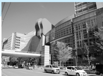
鎌倉街道からみた「ゆめおおおか」

横浜市の副都心の一つ、「上大岡」駅周辺地域は、1990年代以降、上大岡駅西口地区(横浜市が施行者)と、上大岡駅前地区(京浜急行電鉄が施行者)の再開発事業が進み1997年に完了。また、上大岡中央商店街の地域などもB地区として再開発が実施された。現在は、上大岡駅C南地区の再開発事業が進行中。2010年春に三越上大岡店旧館跡地に複合施設が開業予定。