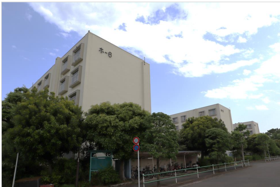
「多摩川住宅ホ号棟」外観(2021年5月撮影)

「ホ号棟」に関しては、2015年11月より事業協力者として住友不動産株式会社と株式会社長谷工コーポレーションが選定され、コンサルタントの株式会社シティコンサルタンツと共に行政協議や全権利者との合意形成活動を行ってまいりました。2020年8月に団地一括建替え決議が成立し、2021年4月に調布市の認可を受け、「多摩川住宅ホ号棟マンション建替組合」が設立されました。なお、組合設立を受け、住友不動産と長谷工コーポレーションは参加組合員としても参画いたします。